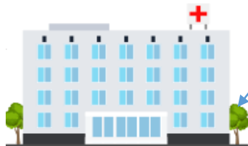
Главное Бюро МСЭ