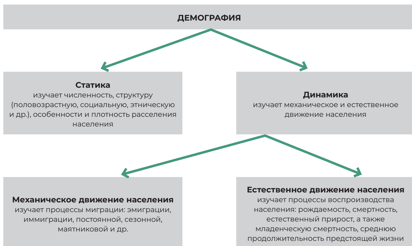
Рисунок 1 – Разделы демографии

Перечень, составляющие предмета изучения и соподчиненность основных разделов демографии приведены на рисунке 1.